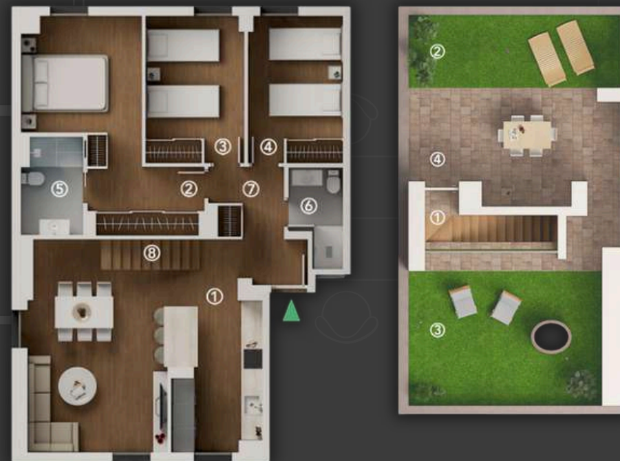
ESCALERA 1 - VIVIENDA 4B

ÚTIL CERRADA P4-P5 84.15m 2 CONSTRUIDA P4-P5 151.00 m 2