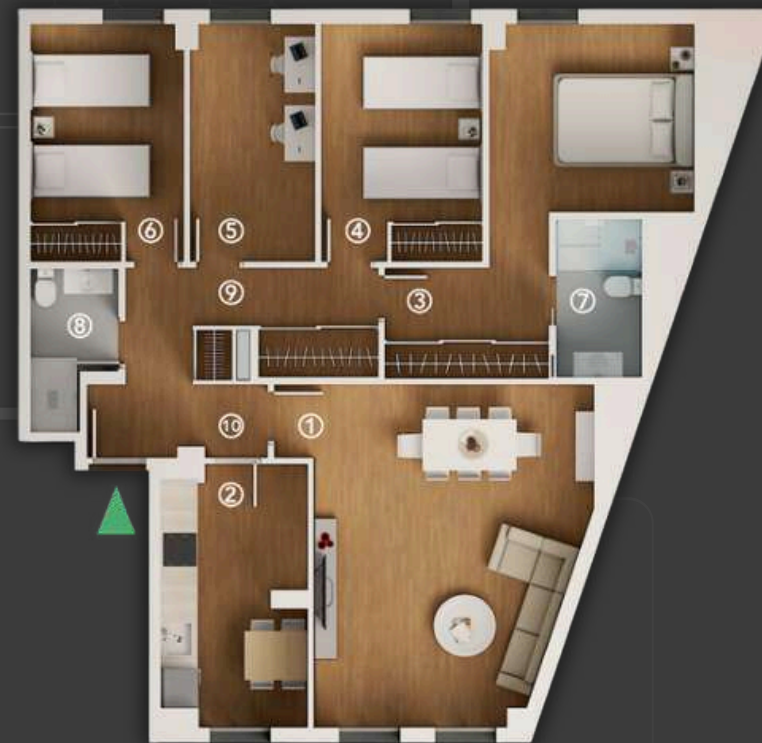
ESCALERA 2 - VIVIENDA 1@3A

Los planos son informativos no contractuales, susceptibles de modificación, pendientes de obtención de licencia municipal. Las superficies son aproximadas, incluida la totalidad de las terrazas, y podrán sufrir modificaciones por necesidades técnicas durante la obra. El mobiliario reflejado tiene carácter meramente decorativos.