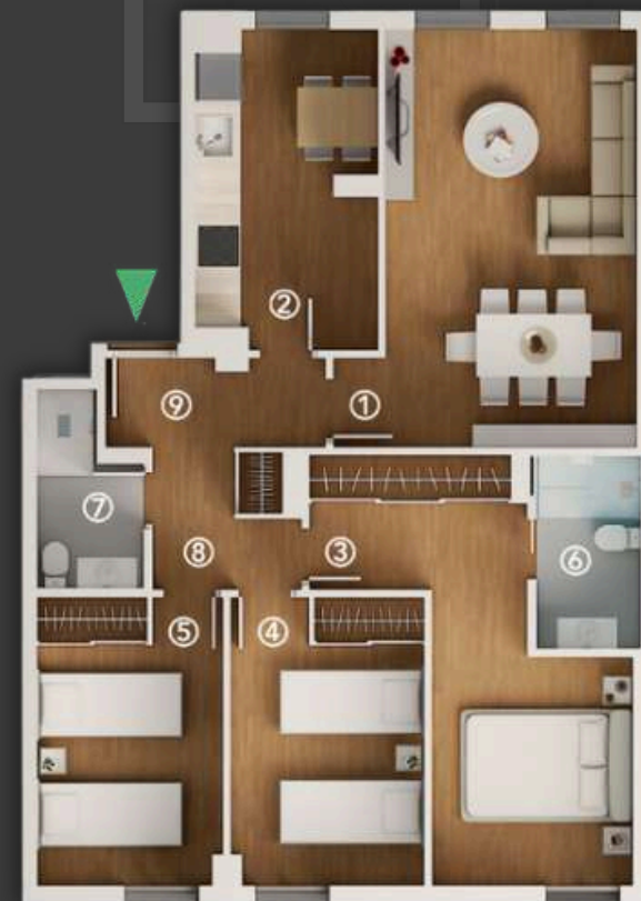
ESCALERA 1@4 - VIVIENDA 1.1@3.A

Los planos son informativos no contractuales, susceptibles de modificación, pendientes de obtención de licencia municipal. Las superficies son aproximadas, incluida la totalidad de las terrazas, y podrán sufrir modificaciones por necesidades técnicas durante la obra. El mobiliario reflejado tiene carácter meramente decorativos.